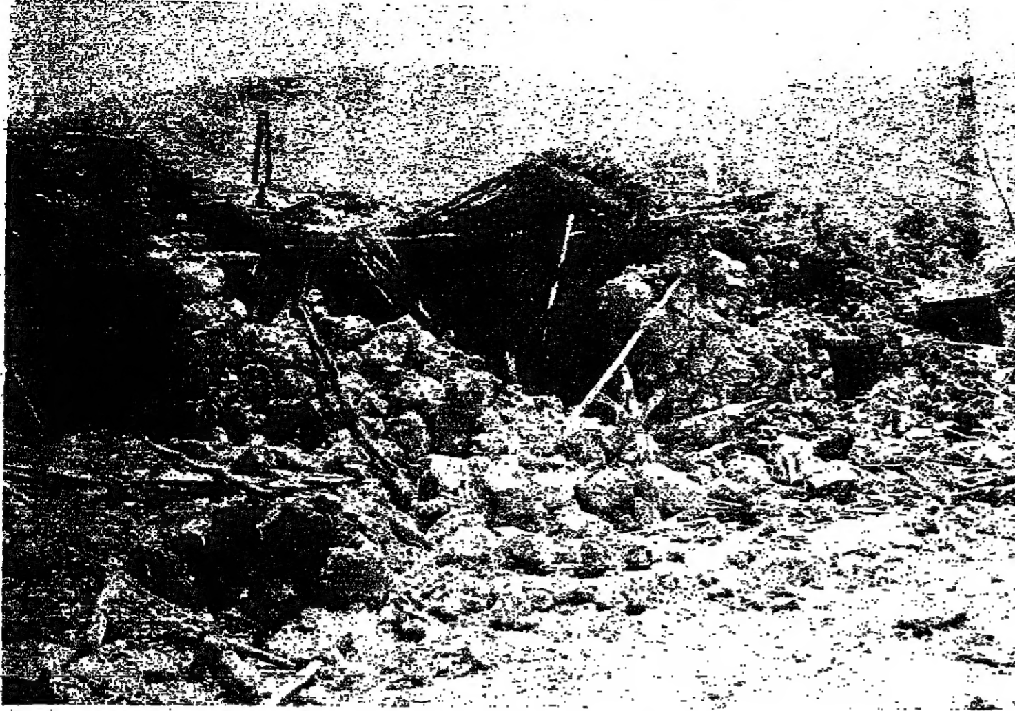
جانب من الخراب الذي خلفه القصف الإسرائيلي في بلدة حام

عشرة بروج .. وقتقت بعض الأضرار في سونانا ، ولكن مهما كبرت خسائرنا ، فإن توهمنا من عزيمتنا .